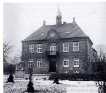
Tinghuset ved torvet i Kjellerup fotografere i anledning af dens 50 års dag i 1959.